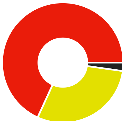
Ekvivalens energia fogyasztás

Gázolaj: 63 320,626 kWh Villamos energia: 1 921 428 kWh Földgáz: 832 465,007 kWh