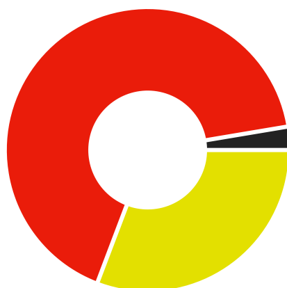
Ekvivalens energia fogyasztás

Földgáz: 1 007 699,73 kWh Villamos energia: 2 180 305 kWh Gázolaj: 86 538,368 kWh