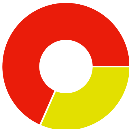
Ekvivalens energia fogyasztás

Földgáz: 1 007 699,73 kWh Villamos energia: 2 180 305 kWh