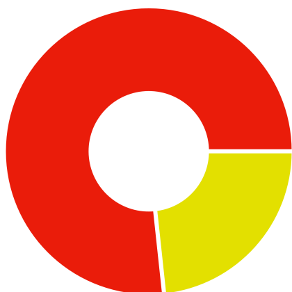
Ekvivalens energia fogyasztás

Földgáz: 624 363,894 kWh Villamos energia: 2 055 776 kWh